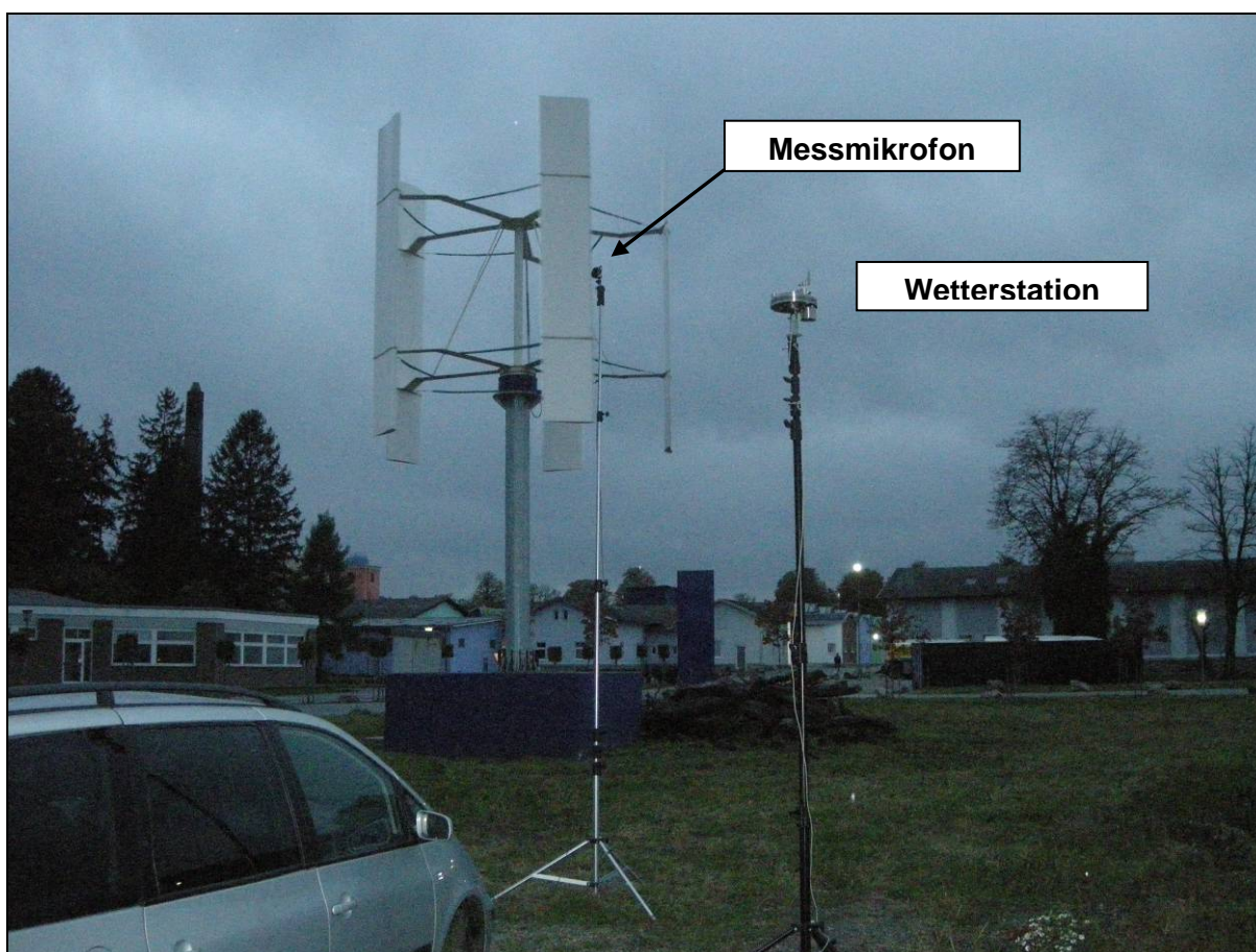
Abb. 3 Windkraftanlage und Messanordnung

Die Anordnung der Messaufnehmer wurde in 16 m Entfernung von der Achse des Rotors in Mitwindrichtung gewählt (Berechnung r_0 nach ÖVE EN 61400-11). Als Messhöhe wurde 4 m über Boden für das Mikrofon gewählt, da nur der Immissionserschalldruckpegel und nicht die Emission der Anlage (Schalleistungspegel) bestimmt werden soll.