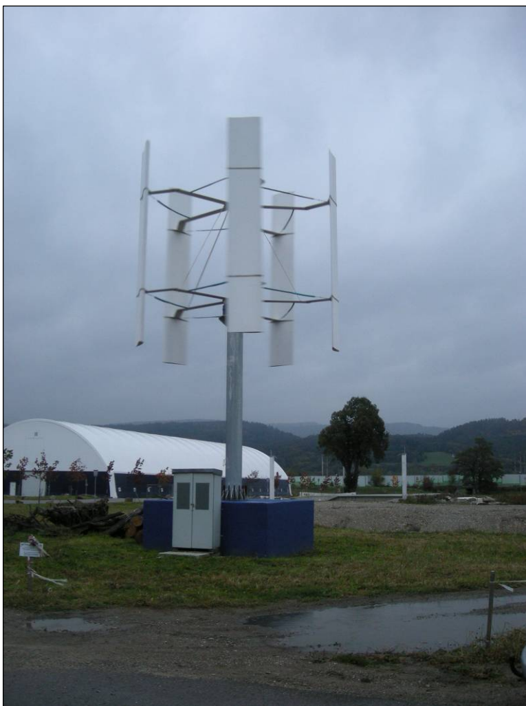
Abb. 1 Windkraftanlage

Das Messobjekt war eine 10 kW Windkraftanlage des Typs PK-10 der Shanghai Aeolus Windpower Technology Co.